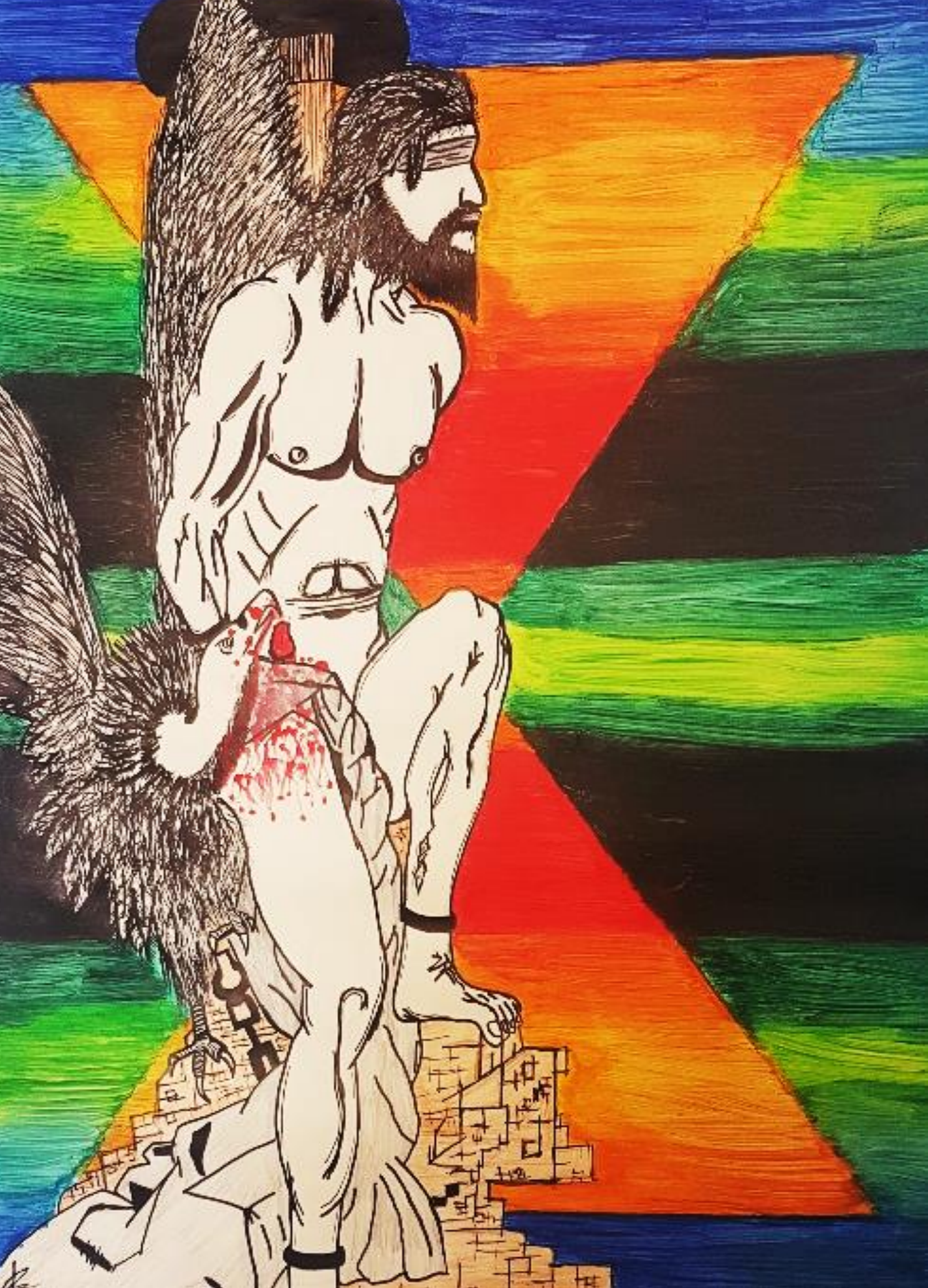
Okovani Prometej, rad: Ivan Jelečević