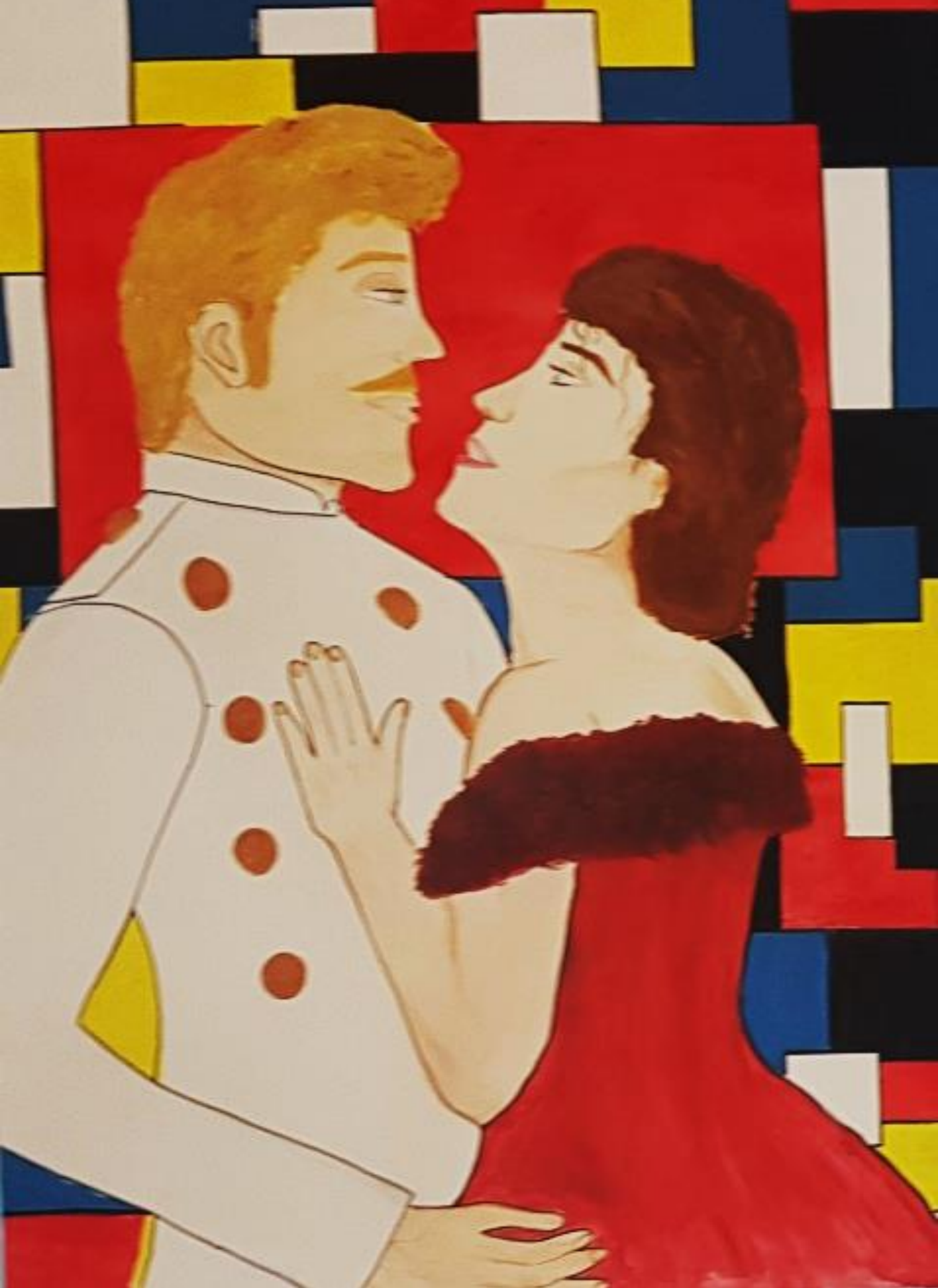
Tolstoj: Ana Karenjina i Vronski, rad: Lucija Ivok