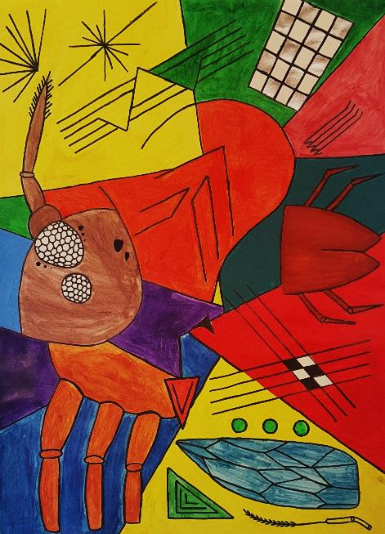
Kafka: Preobrazba, rad Luka Lebo i Mijo Begić