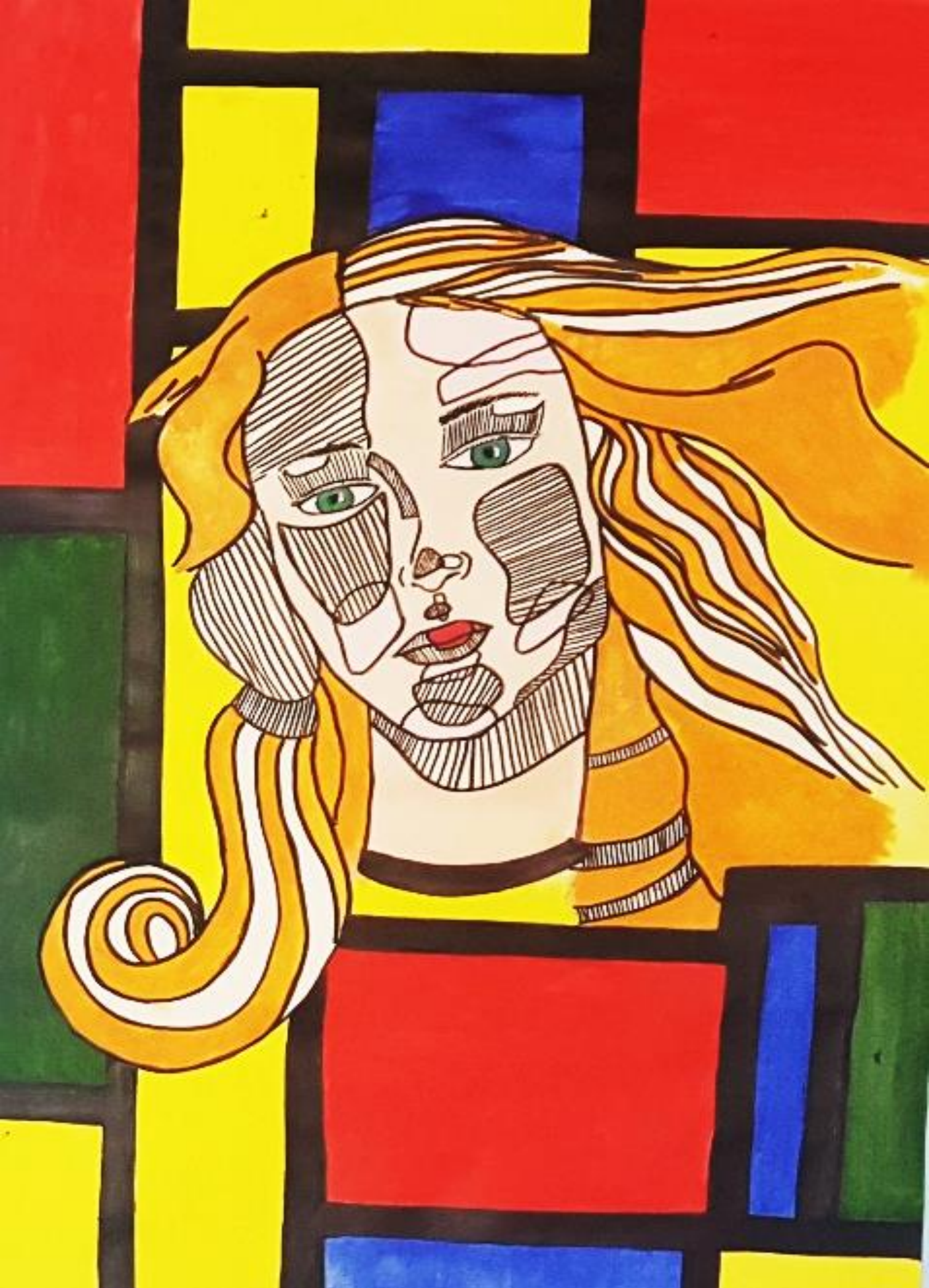
Grčka božica Afroditá, rad: Mateja Perko