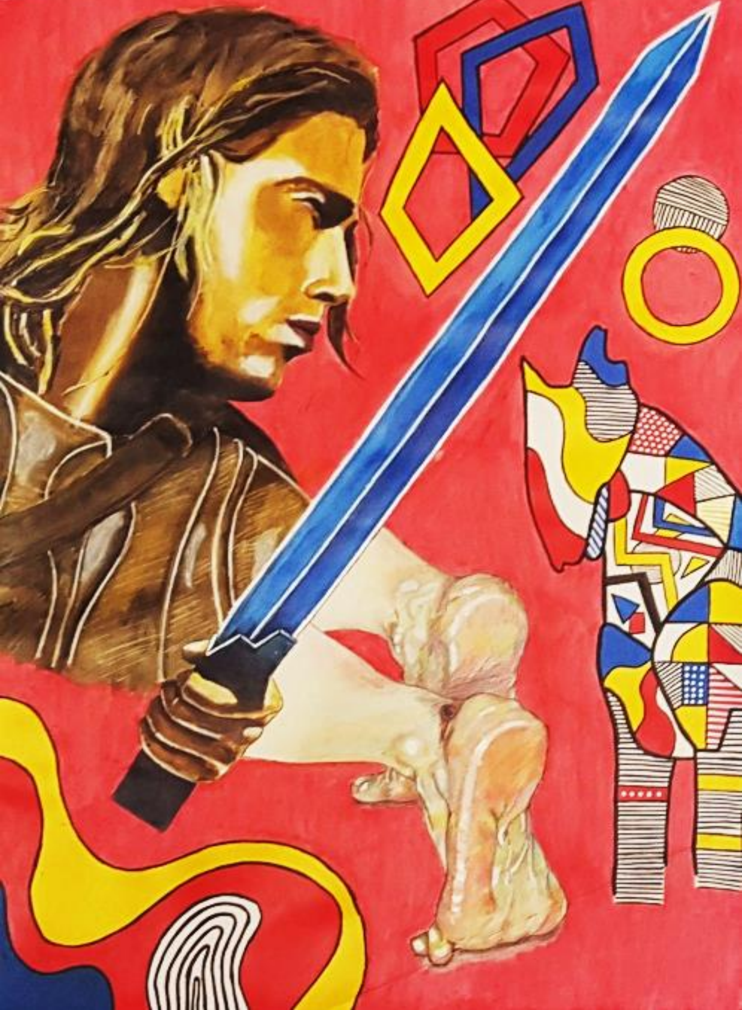
Homer: Ahilej (Ilijada), rad: Franjka Džoja