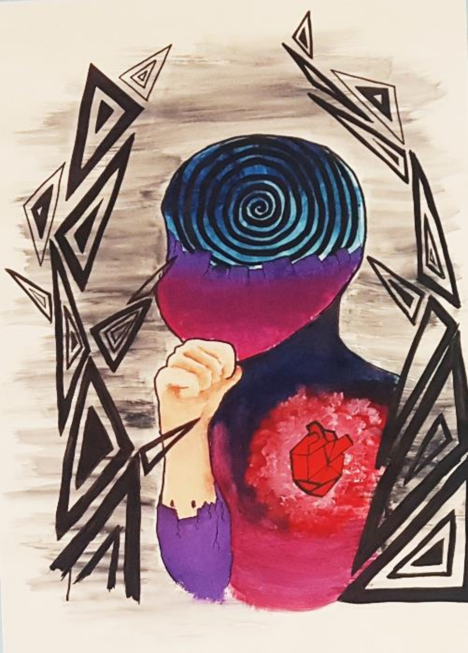
I. Brlić Mažuranić: Potjeh, rad: Karla Kljajić