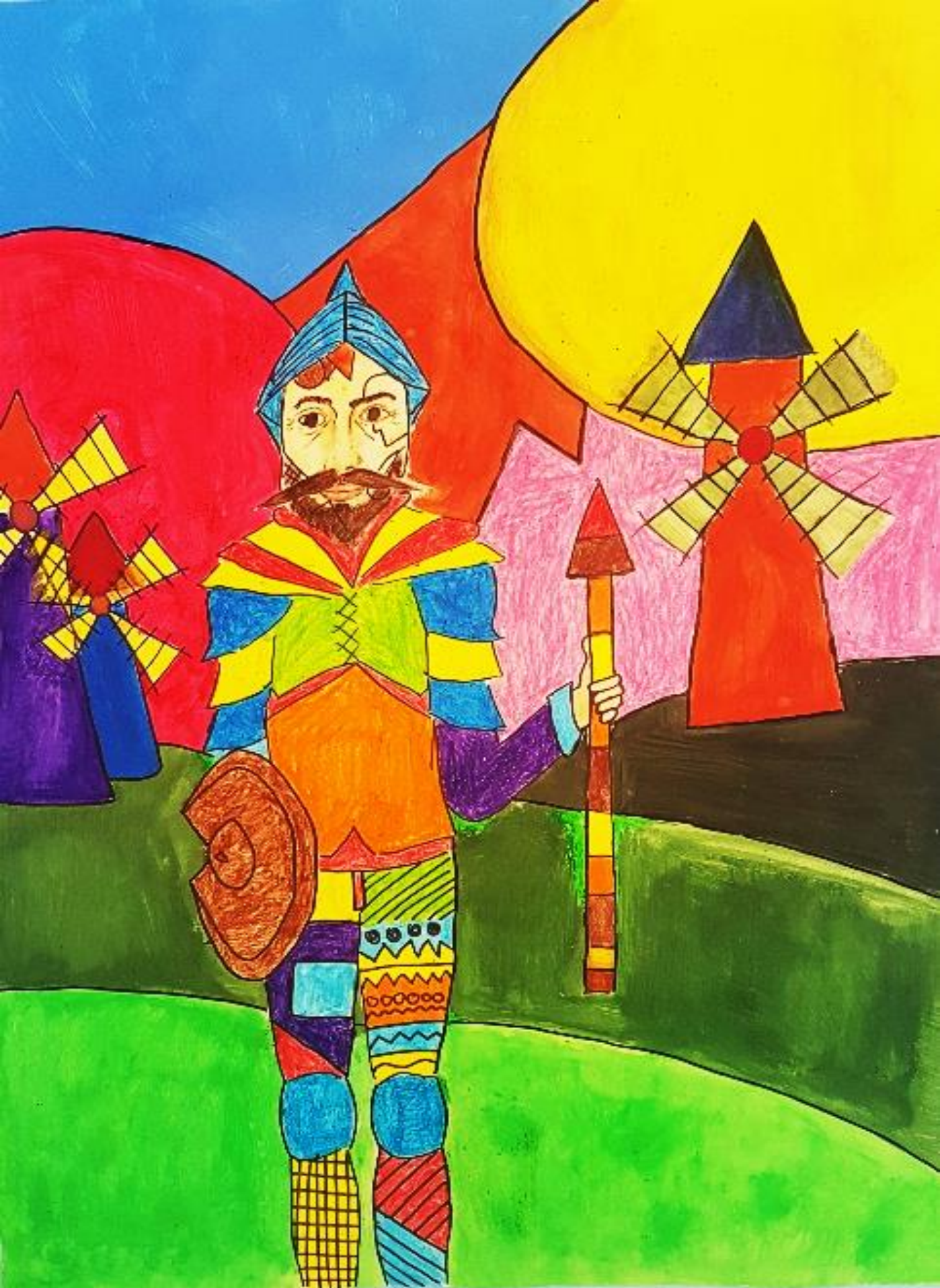
Cervantes: Don Quijote, rad: Jana Plazanić