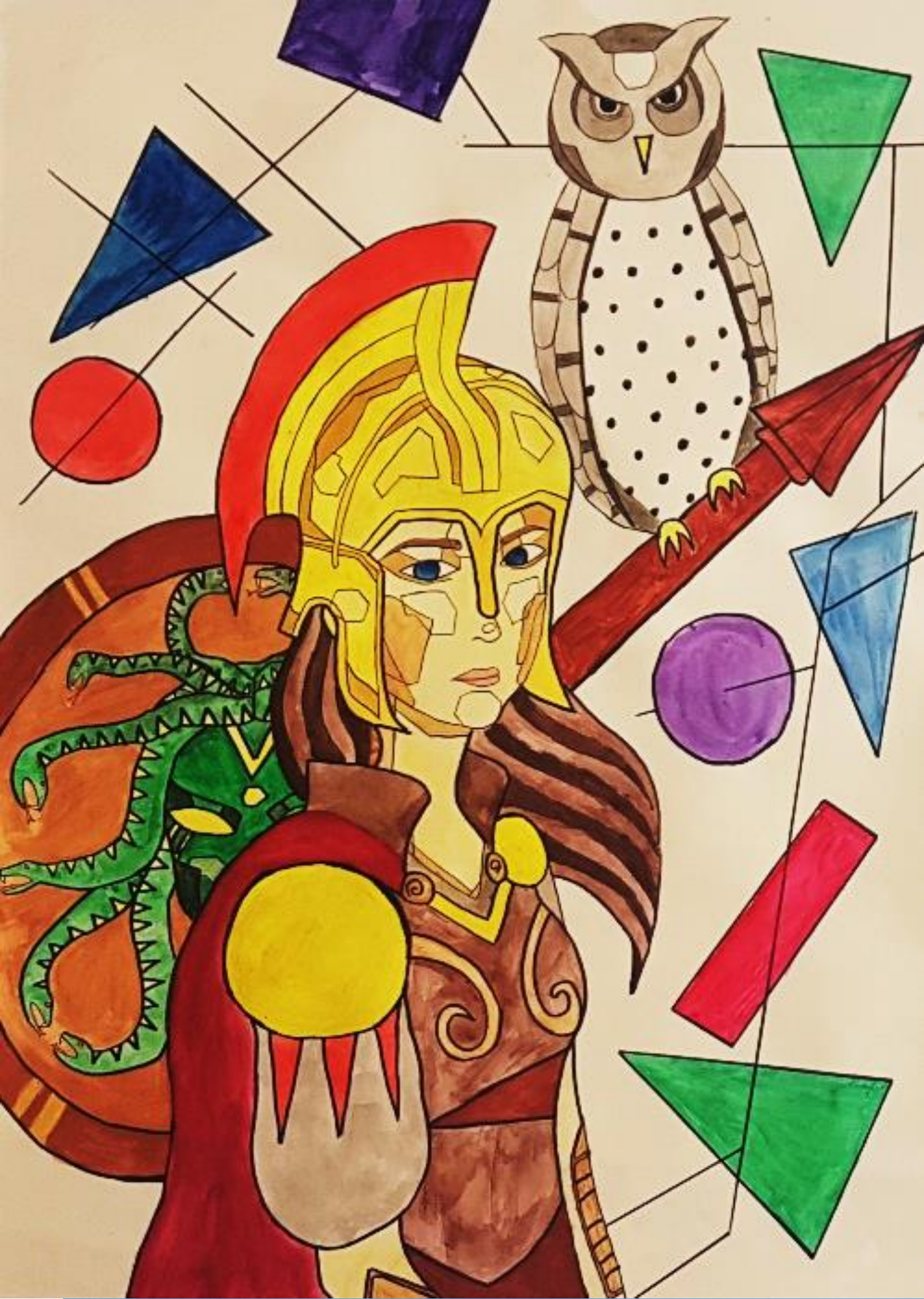
Atena, božica mudrosti, rad: Anamarija Martinjak