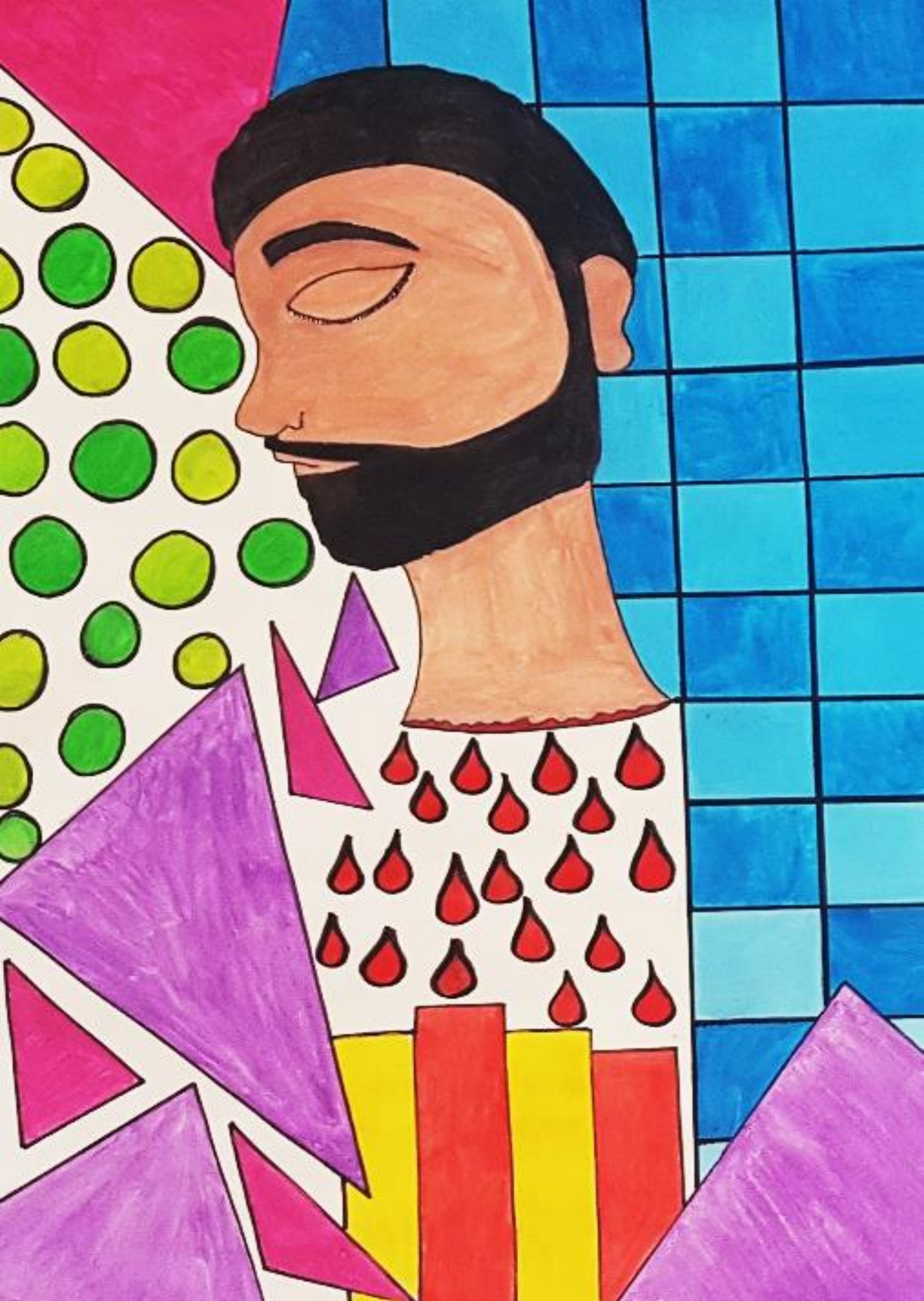
Judita i Holoferno, rad: Mia Vranić