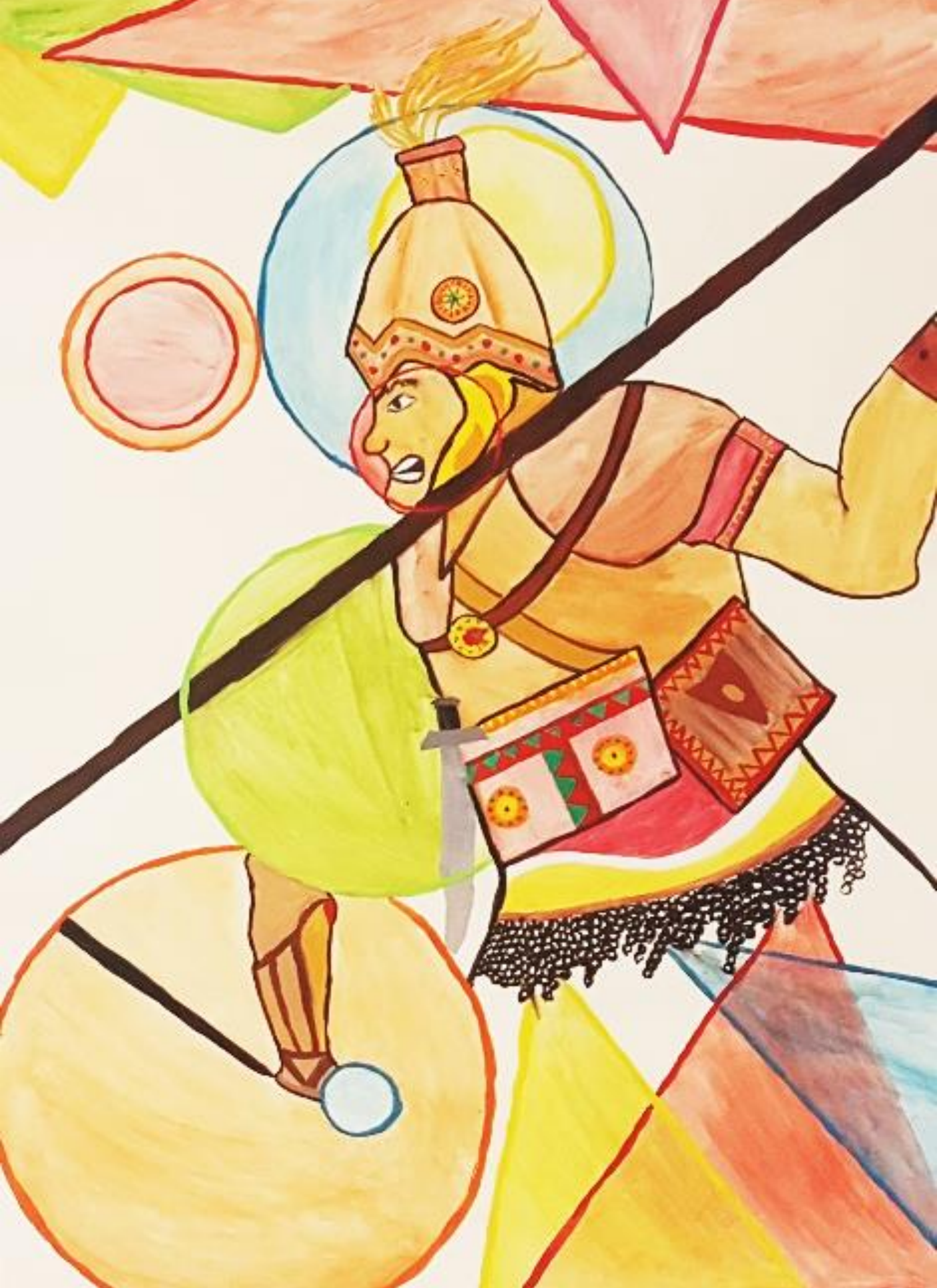
Homer: Ahilej (Ilijada), rad: Iva Matković