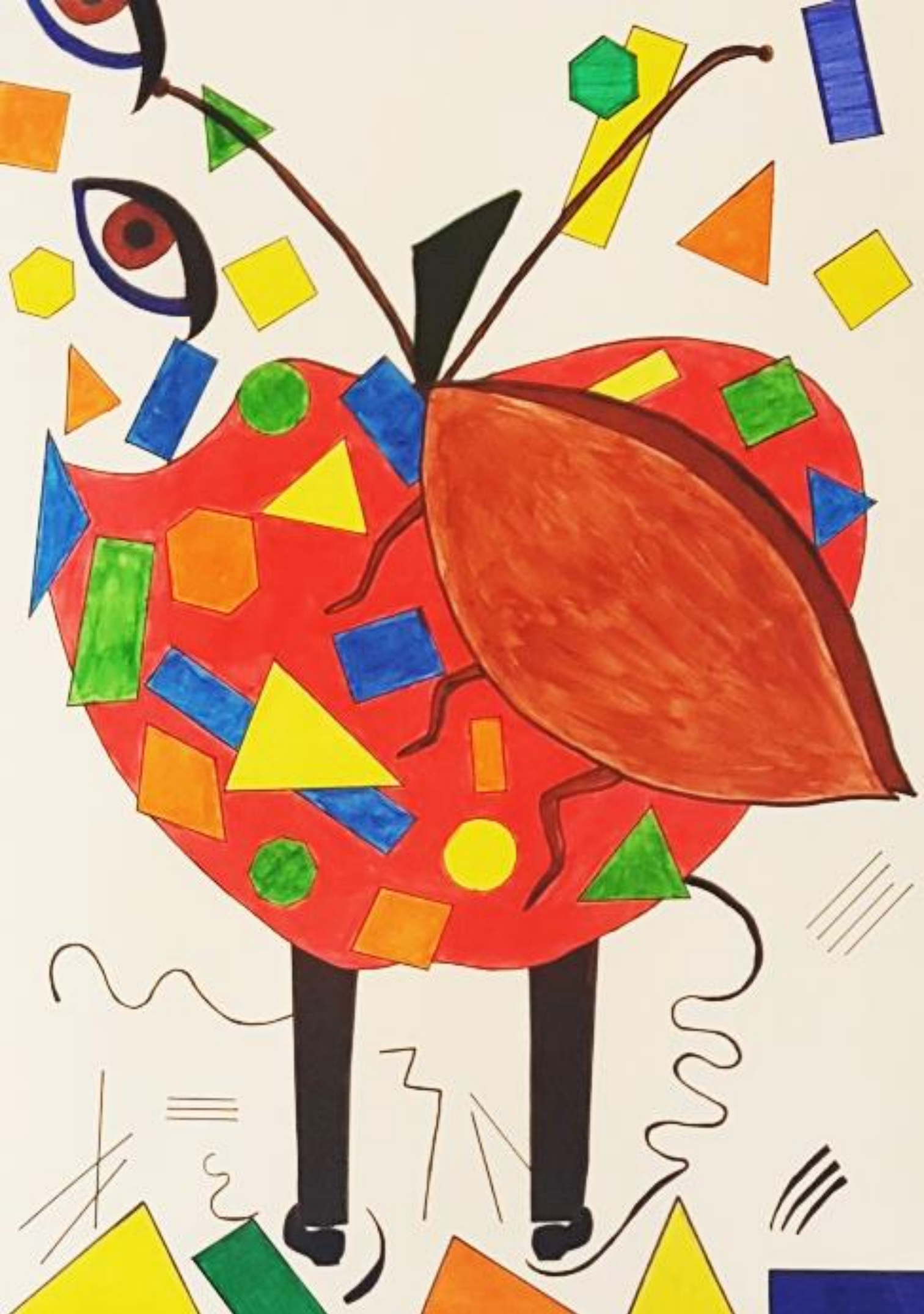
Kafka: Preobrazba, rad: Ivona Krnjić